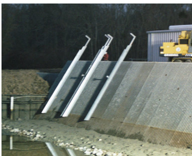
Montaje lateral para el modelo de rastrillo único

Diseñado para adaptarse a su rejilla de barras existente y a las necesidades únicas de su sitio.