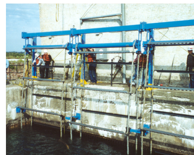
Montaje en L para el modelo de rastrillo único